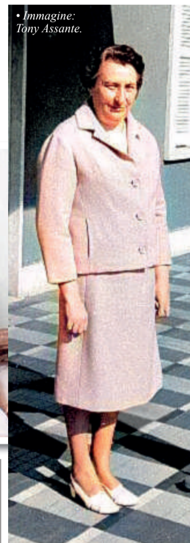
• Immagine: Tony Assante.

«Allo stesso tempo provai una grande e indescrivibile gioia, come se la Madonna fosse in me. In quel momento», disse in seguito la Carini, «pregai con più fervore per il bene della mia anima, per coloro che mi stavano a cuore, e per la conversione dei peccatori».