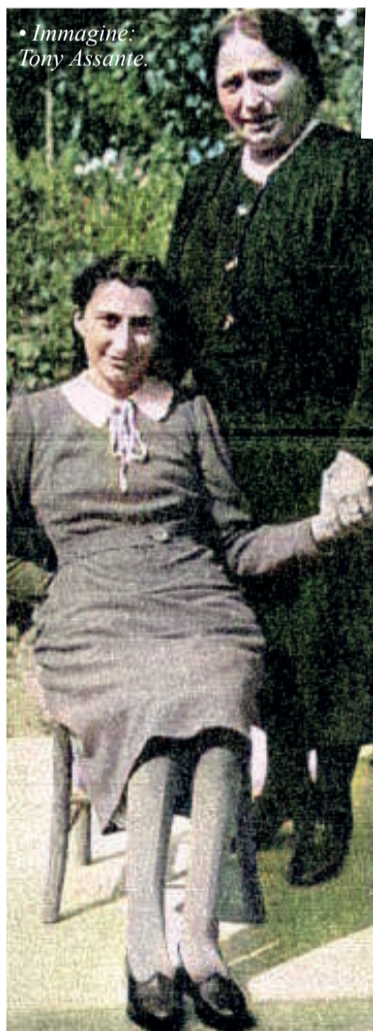
• Immagine: Tony Assante.

La vita della Carini «è stata bellissima, ma attraversata ▶